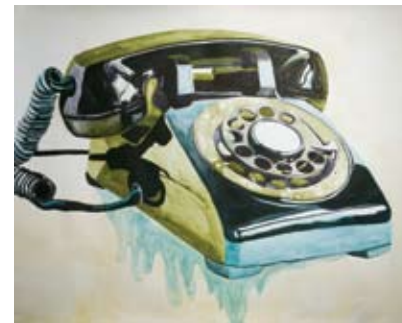
5- Christopher Lindsay Jump , 2007 Pin 102 x 90 x 75 cm