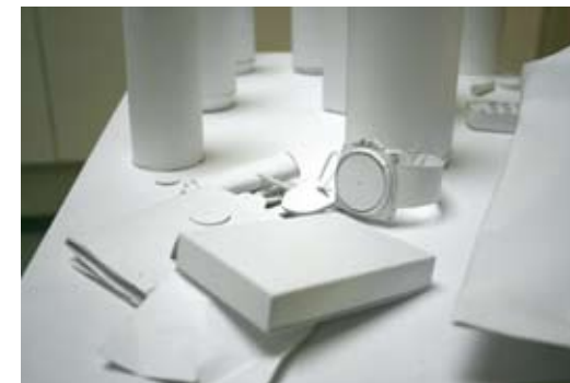
1- Jenna Powell Sans titre , 2008 Acrylique et huile sur toile 152,5 x 213,5 cm