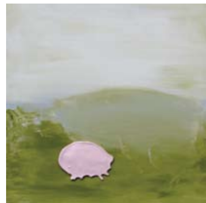
5- Nathalie Quagliotto Maturity Bend , 2007 Métal 335 x 182 x 61 cm