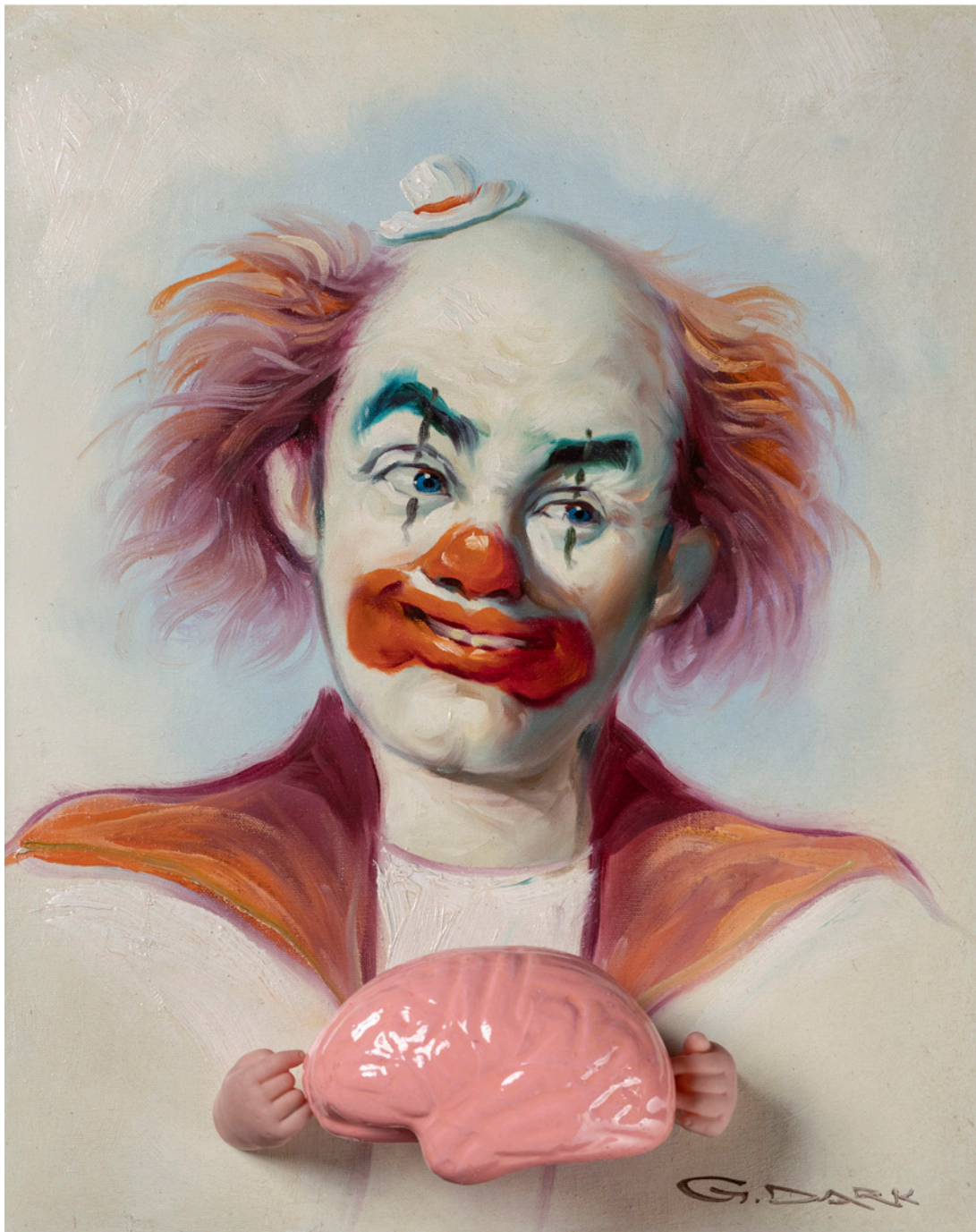
Bevan Ramsay Secret, 2019 technique mixte / mixed media 50 x 39 x 13 cm (19.5 x 15 x 5 in)