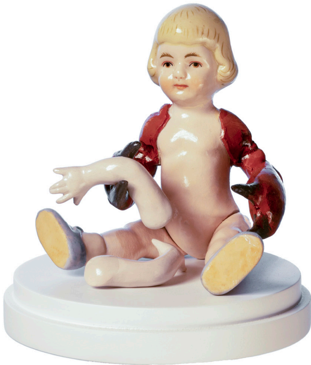
Bevan Ramsay Japan, 2019 technique mixte / mixed media 14 x 14 x 15 cm (5.5 x 5.5 x 6 in)