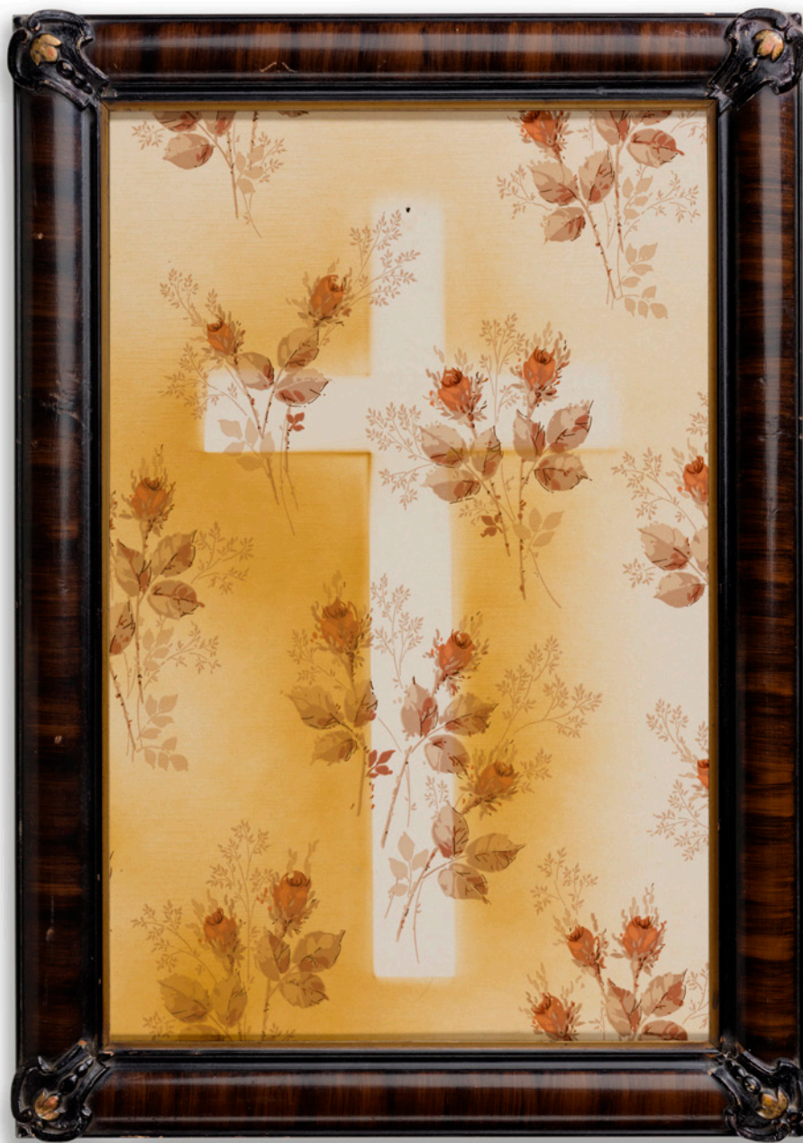
p. 19 Jennifer Small Time Takes a Cigarette , 2017 technique mixtes / mixed media 61 x 43 x 1 cm (24 x 17 x 0,5 in)