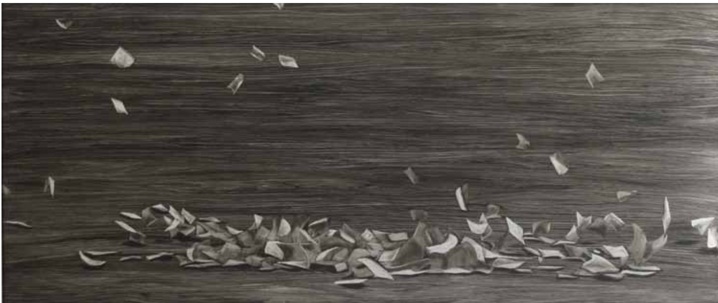
Jinny Yu, Verba Volant 03 (detail), 2009, huile sur aluminium, / oil on aluminum 61 x 142 cm

Certaines de ces pages ont pénétré entièrement notre monde. L'une, chiffonnée, repose entre la fragilité de ce qu'elle représente et la durabilité de son matériau. Il s'agit d'une page noire, sur laquelle rien n'est inscrit si ce n'est que l'indice du mouvement de la main qui la froisse. L'autre, de forme allongée, se tient là, debout, prête à quitter le mur.