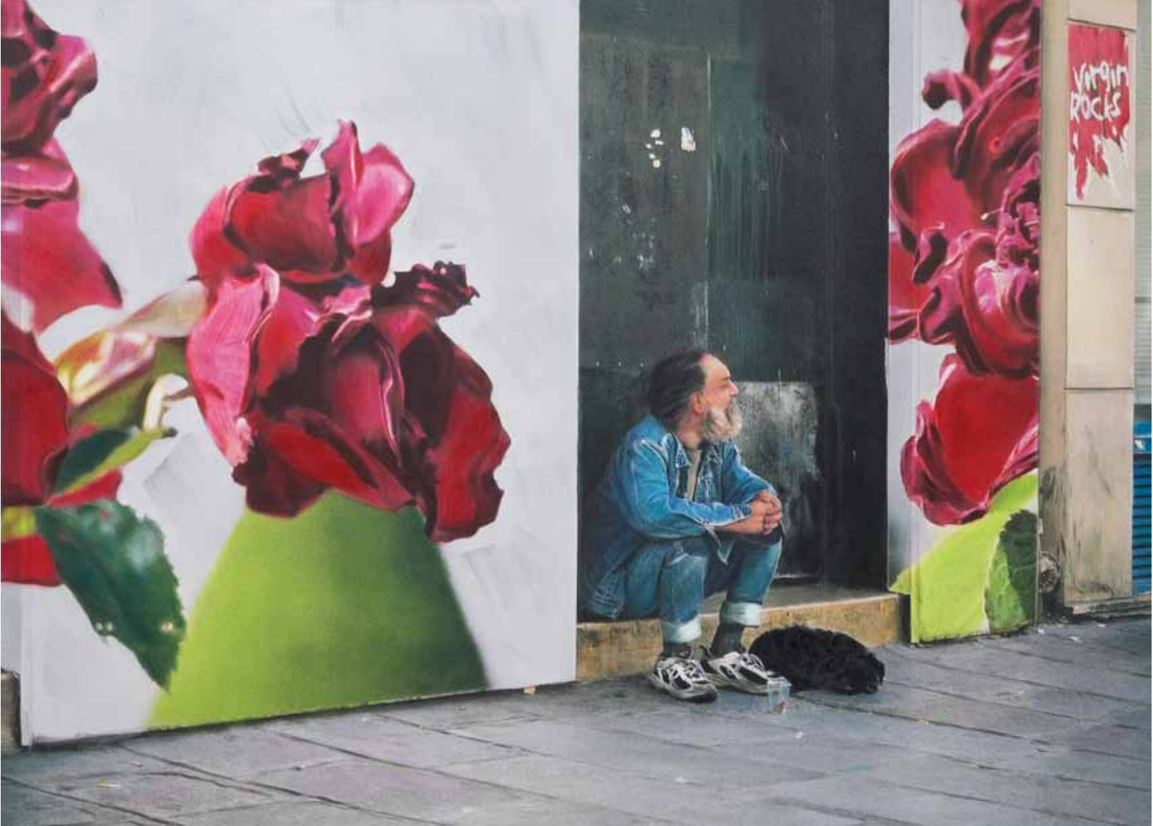
Danielle R O Y , Le Samaritain rue Rivoli ciel gris , 2004, huile sur photo imprimée sur toile / oil on photograph printed on canvas