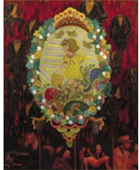
Bonnie Lewis, Dinah (detail), 2003